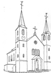
St. Peter Wiebelsheim