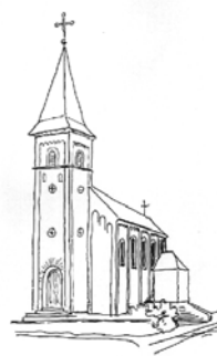
St. Alban Perscheid