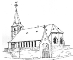
St. Johannes d.T. Damscheid