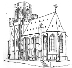
St. Martin Oberwesel